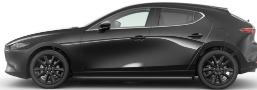
JET BLACK (41W) 1)