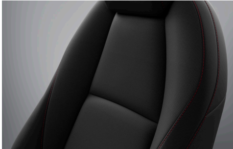
Stoffbezug in Schwarz mit roten Ziernähten