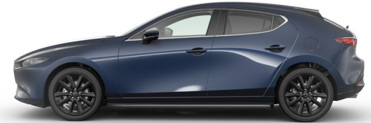
DEEP CRYSTAL BLUE (42M) 1)