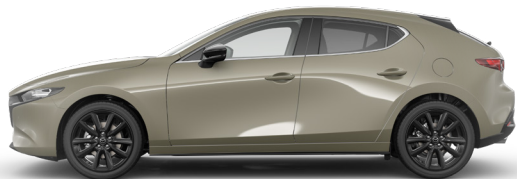
ZIRCON SAND (48T) 1)