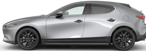
MACHINE GREY (46G) 2)