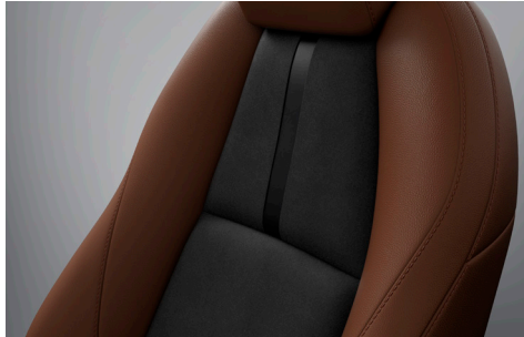
Sitzbezüge (Terrakotta Kunstleder/ Schwarz Leganu®)