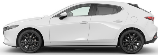
ARCTIC WHITE (A4D)