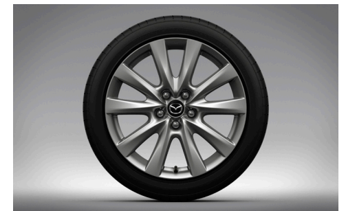
18-Zoll-Leichtmetallfelgen in Silbergrau mit Hochglanzfinish