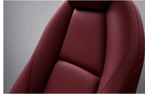
COMFORT-RED-PAKET LederAusstattung* in Burgunderrot