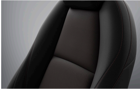
Stoffbezug „Canvas“ in Schwarz