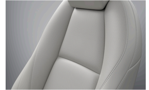
COMFORT-WHITE-PAKET LederAusstattung* in Pure White