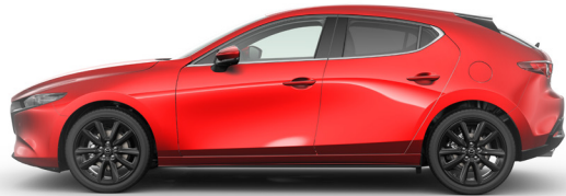
SOUL RED CRYSTAL (46V) 2)