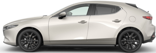
PLATINUM QUARTZ (47S) 1)