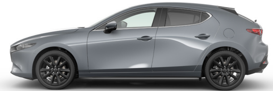
POLYMETAL GREY (47C) 2)