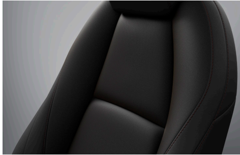
COMFORT-BLACK-PAKET LederAusstattung* in Schwarz