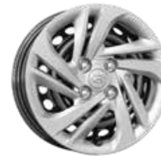
14-Zoll-Stahlfelgen mit Radzierblende 175/65 R14 3