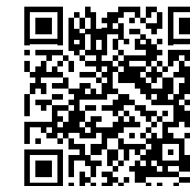
Jetzt Ihren Hyundai i10 konfigurieren.