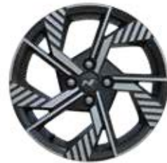
16-Zoll-Leichtmetallfelgen 195/46 R16 2