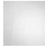
Atlas White (Uni) 1