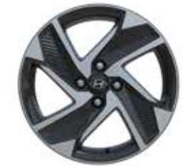
16-Zoll-Leichtmetallfelgen 195/45 R16 5