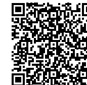
Jetzt Angebot anfordern.