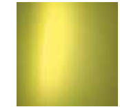
Lucid Lime (Metallic) 1