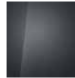
Aurora Grey (Mineraleffekt) 1