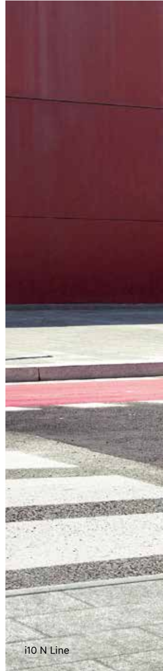
i10 N Line

Ein Blick genügt, um die Motorsportwurzeln des neuen i10 N Line Designs zu erkennen. Sein Äußeres wurde dafür mit typischen N Line Elementen im Kühlergrill und an den Stoßfängern aufgewertet. Das Ergebnis: ein sportlicher Look, der an die High-Performance N Modelle von Hyundai angelehnt ist. Die überarbeiteten LED-Rückleuchten mit neu gestalteter Lichtsignatur sorgen für einen dynamischeren Auftritt und noch bessere Sichtbarkeit. In Verbindung mit den exklusiven 16-Zoll-Leichtmetallrädern unterstreichen sie den kraftvollen Charakter des neuen Hyundai i10 N Line. Darüber hinaus begeistert auch das Interieur mit sportlichen Details. Das exklusive N Line Lenkrad, der Schalthebel und die Lüftungsdüsen werden von roten Designelementen wirkungsvoll in Szene gesetzt, während die neu gestalteten Sitze ein dynamisches Muster mit roten Kontrastnähten an den Start bringen.