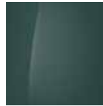
Mangrove Green (Mineraleffekt)

Wählen Sie Ihre favorisierte Außenfarbe für den neuen Hyundai i10 und setzen Sie die auffällige Silhouette stilvoll in Szene.