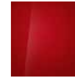
Dragon Red (Mineraleffekt) 1