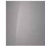
Lumen Grey (Mineraleffekt) 1