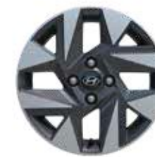
15-Zoll-Leichtmetallfelgen 185/55 R15 4