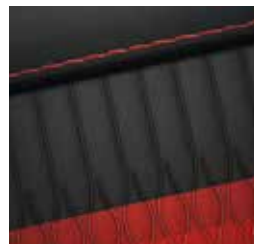
Sitzpolsterung in Stoff Schwarz mit roten Ziernähten

Die Sitzpolster setzen im Innenraum des Hyundai i10 N Line sportliche Akzente.